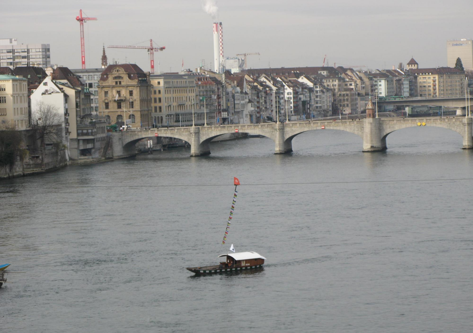
Basel (CH)